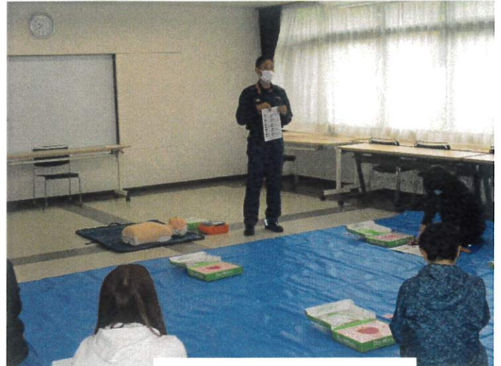
講義応急手当の必要性