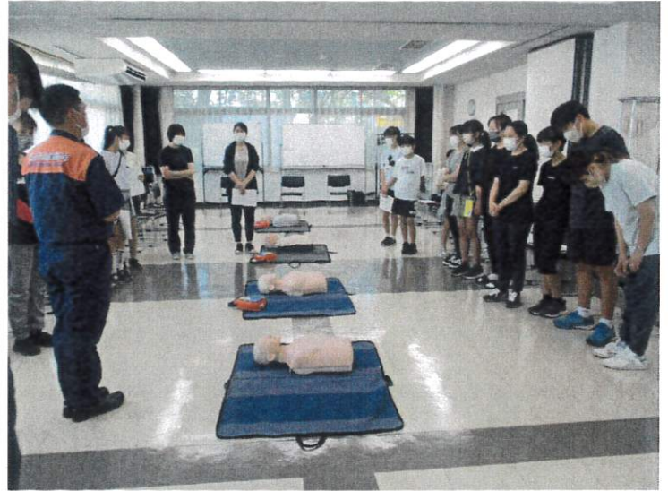
応急手当の必要性説明