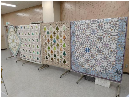
椿峰キルティングビー