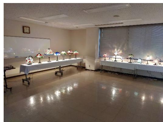
スタンドグラスライト