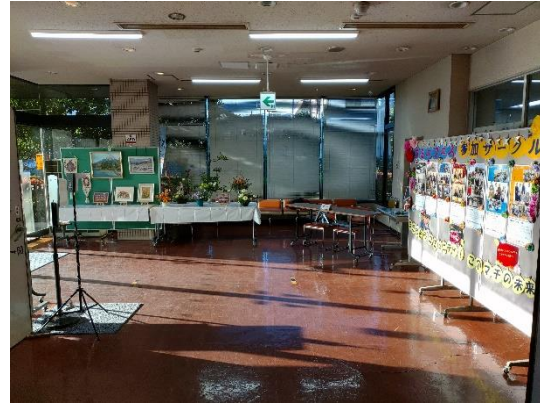
受付及び紹介ボード