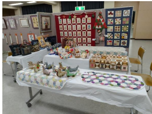
椿峰キルティングビー