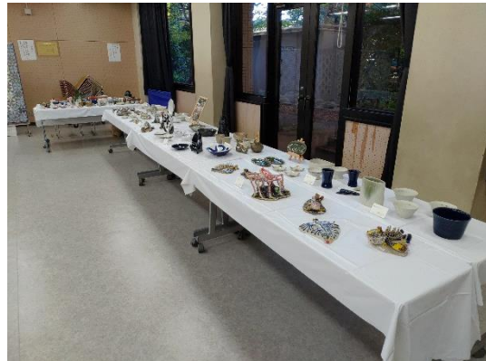
椿峰陶芸サークル