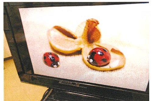
椿の実がてんとうむしに変身しました。