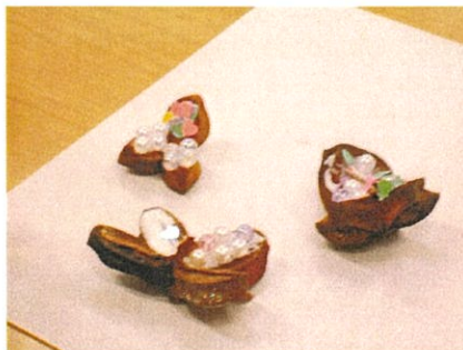
できあがりました。かわいくできました。