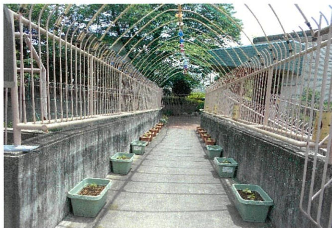
5月22日プランターにゴウヤとアサガオを植える