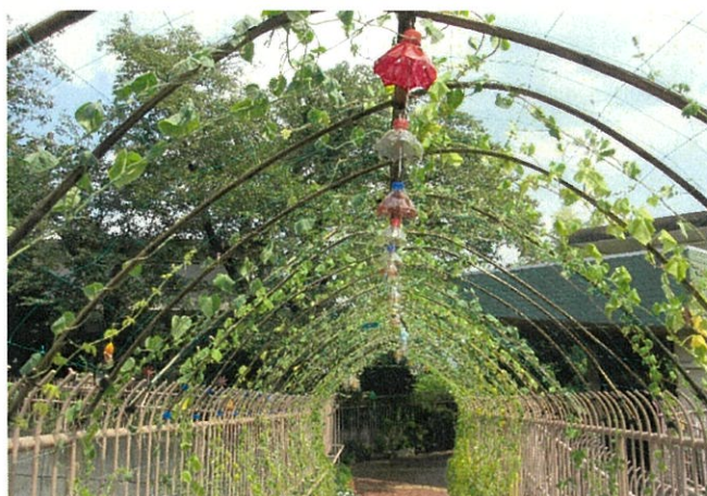
ペットボトルで作った傘と風鈴を飾る