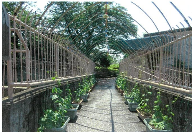
6月22日少しずつ生育してきている