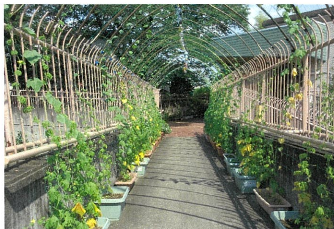
7月3日何とかアーチの上まで伸びてきている